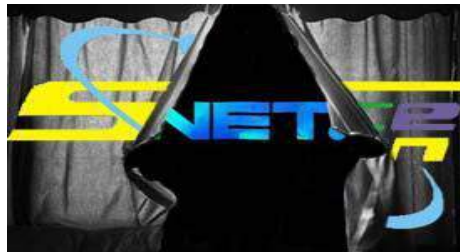
Gambar I

Dilihat dari segi komunikasi pemasaran langkah manajemen Net TV menyisipkan logo Net TV satu bulan menjelang siaran perdananya merupakan langkah awal dalam memperkenalkan Net TV ke khalayak. Perbedaan segmen, target dan posisi Net dengan Spacetoan membuat Net TV harus lebih agresif memperkenalkan Net TV. Upaya terus memperkenalkan Net TV secara konsisten dan masif kepada khalayak terus dilakukan oleh manajemen Net TV, hal ini dapat dilihat dari jumlah kota yang dapat menikmati tayangan Net TV yang terus bertambah menjadi 188 kota di seluruh Indonesia, dari yang sebelumnya hanya di Jakarta, Surabaya, Bandung dan Medan.