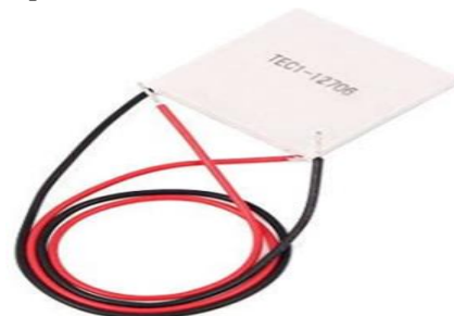
Gambar 5 Peltier

Prinsip pendinginan Thermo-Electric ini ditemukan pertama kali pada tahun 1834 oleh Jean Peltier , sehingga hasil penemuannya ini sering disebut " Pendingin Peltier " Apabila ada aliran arus listrik,maka akan disertai dengan panas hasil dari arus tersebut ( pemanasan Joule ).