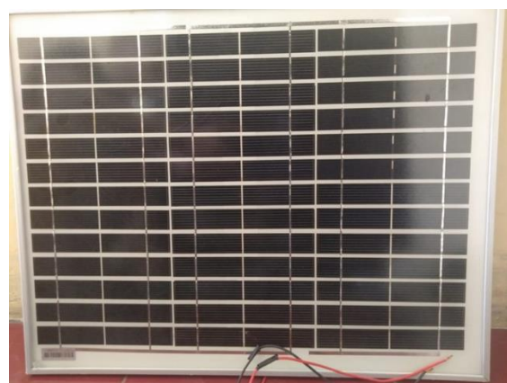
Gambar 3 Solar cell

Solar Cell adalah suatu perangkat atau komponen yang dapat mengubah energi cahaya matahari menjadi energi listrik dengan menggunakan prinsip efek Photovoltaic. Photovoltaic adalah suatu fenomena dimana munculnya tegangan listrik karena adanya hubungan atau kontak dua elektroda yang dihubungkan dengan sistem padatan atau cairan saat mendapatkan energi cahaya. Oleh karena itu, Sel Surya atau Solar Cell sering disebut juga dengan Sel Photovoltoic (PV). Efek ini ditemukan oleh Henri Becquerel pada tahun 1839.