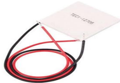
Gambar 5 Peltier

Prinsip pendinginan Thermo-Electric ini ditemukan pertama kali pada tahun 1834 oleh Jean Peltier , sehingga hasil penemuannya ini sering disebut " Pendingin Peltier " Apabila ada aliran arus listrik, maka akan disertai dengan panas hasil dari arus tersebut ( pemanasan Joule ).