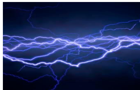
Gambar 6. Arus listrik

Arus listrik dapat didefinisikan sebagai muatan listrik yang mengalir per satuan waktu. Arus listrik terdiri atas dua jenis, yaitu arus listrik searah (DC = Direct Current ) dan arus listrik bolak-balik (AC = Alternating Current ).