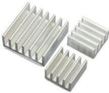
Gambar 4 Heatsink Aluminium

Heatsink adalah logam dengan design khusus yang terbuat dari aluminium (Al) atau tembaga (Cu) (bisa merupakan kombinasi dari kedua material tersebut) yang berfungsi untuk memperluas transfer panas dari prosesor.