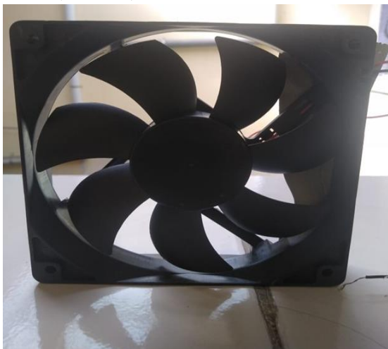
Gambar 2 Fan

Digunakan untuk menghasilkan angin, fungsi yang umum adalah untuk pendingin udara, penyegaran udara, ventilasi (exhaust fan), pengering (umumnya memakai komponen penghasil panas). Fan (Kipas) juga ditemukan dimesin penyedot debu dan berbagai ornamen untuk dekorasi ruangan.