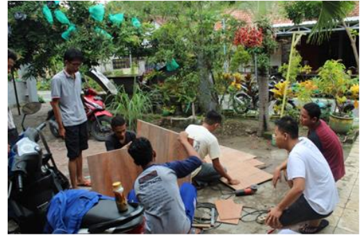
Gambar 2 : Pemotongan dan Pemasangan Papan

Berikut proses-proses pembuatan papan informasi Desa Bulangan :