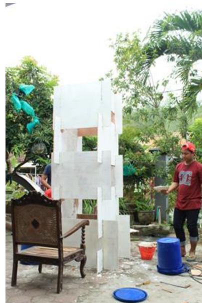
Gambar 4 : Pelapisan dempul pada papan