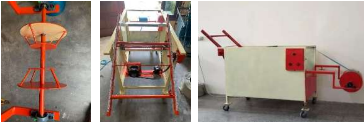
GAMBAR 1. 1 mesin roll streaping baru

Melalui dari permasalahan tersebut perlu adanya pembuatan alat baru roll streaping yang lebih baik dari pada alat roll streaping yang lama. Alat baru roll streaping ini akan inovasi dari mesin lama yaitu bagian tempat bahan baku tempat tali streaping dibuat agak mengkerucut supaya dapat lebih flexible dalam pemasangan bahan baku pada roll, penambahan ukuran pada tempat pemetalan tali supaya lebih cepat pada saat penyetalan ukuran pada tali streaping sesuai yang dibutuhkan dan memperjauh jarak roll bahan baku sama roll tali streaping mengurangi tekanan supaya tidak mudah pecah.