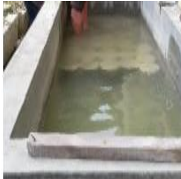
Gambar 4 Perawatan Beton [Times New Roman, 11]