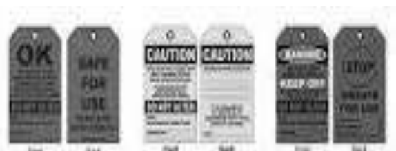
Gambar 3. Tag Scaffolding

Tag scaffolding , terdiri dari 3 tipe warna dan jenis, yaitu hijau untuk scaffolding yang aman digunakan. Kuning untuk scaffolding yang tidak lengkap pemasangannya. Merah untuk scaffolding yang tidak aman digunakan.