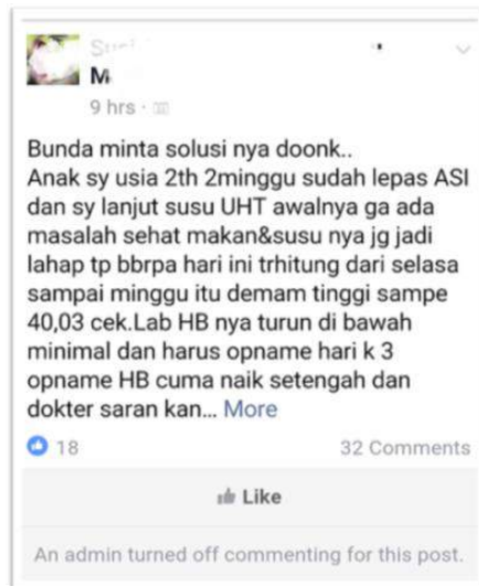
Gambar 5.1. Proses gatekeeping oleh admin dengan mematikan fitur komentar untuk post ini

Jika fitur komentar tidak dimatikan, risiko yang dapat terjadi adalah ibu yang memposting tersebut lebih memilih saran dari anggota lain berdasarkan pengalaman pribadi dan pendapat anggota lain tersebut, dibandingkan saran dari tenaga kesehatan professional yang akan mendiagnosa anaknya berdasarkan observasi dan keahlian medis yang dimilikinya. Kasus ketiga adalah aktivitas yang paling sering dilakukan Admin, yaitu memberi comment di kolom komentar dengan memberikan informasi yang professional. Professional dalam hal ini adalah Admin akan berkomentar berdasarkan keahliannya sebagai konselor menyusui bersertifikat. Dalam komunikasi konseling, konselor diharapkan memberikan dukungan penghargaan dengan mengatakan kembali ( reflect back ) apa yang dikatakan ibu atau berempati, bertanya dengan pertanyaan terbuka lalu memberikan informasi relevan yang diperlukan (Sentra Laktasi Indonesia, 2016). Karena Admin yang memberikan comment merupakan konselor menyusui, maka ditemukan bahwa gaya komunikasi mereka merefleksikan strategi komunikasi konseling tersebut: