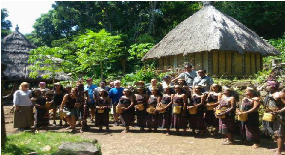
Gambar 4.1. Foto bersama para tamu dan para penari setelah selesai lego-lego