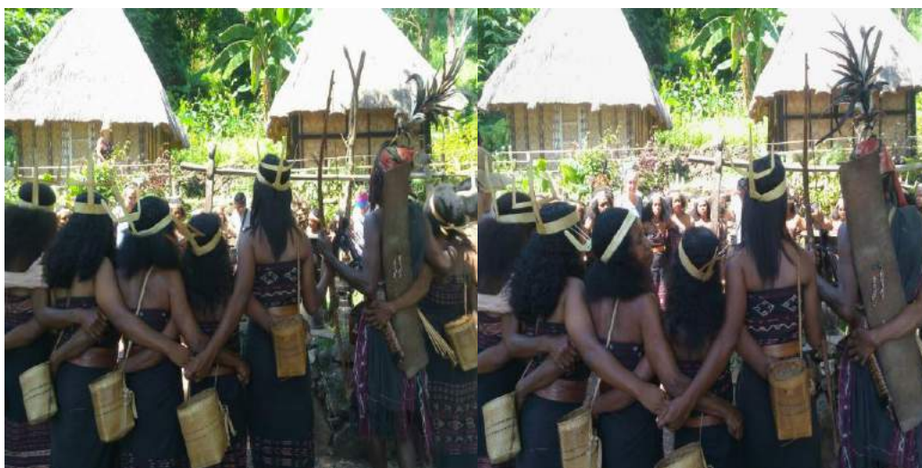
Gambar 4.2. Foto lego-lego bersama dengan tamu dari luar negeri