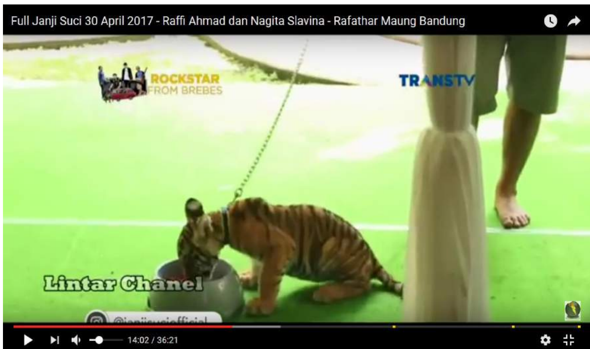
Gambar 1. Harimau Benggala (panther tigris tigris) berumur 4 bulan milik sepupu Raffi di Bandung

Pada tayangan tersebut, Raffi dengan bangga menunjukkan satwa-satwa yang dipiara sepupunya tersebut tanpa paham bahwa satwa-satwa tersebut dilindungi.