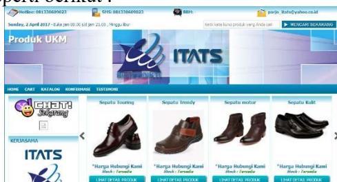
Gambar 1. desain website alamat : pemasaranukm.com.

Portal e-commerce yang disediakan untuk responden dirancang dengan menggunakan metode CMS model prestashop. Tampilan dari portal tersebut adalah sebagai berikut : Setelah dilakukan modifikasi memasukkan beberapa gambar produk responden, maka dihasilkan tampilan seperti berikut :