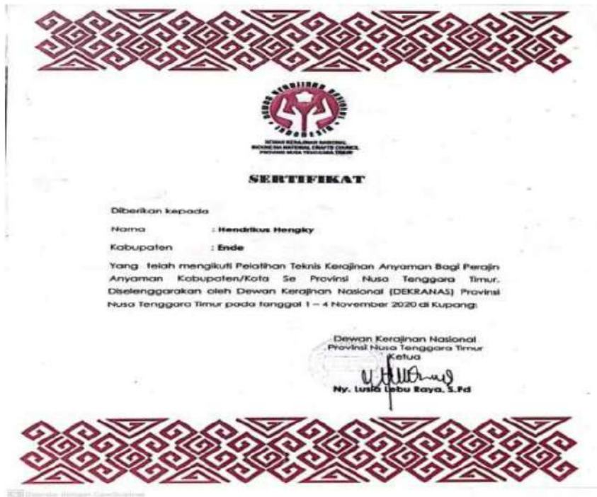
Gambar 1.4 Sertifikat Peserta Pelatihan Teknis Kerajinan Anyaman Bambu

(DEKRANAS) pada tanggal 1-4 November 2020 di Kupang. Kemudian kegiatan berkelanjutan dalam Peningkatan Kapasitas Usaha Masyarakat Kabupaten Ende pada tanggal 29-30 Agustus 2022 yang dilaksanakan di kabupaten Ende. Dari pelatihan yang diperoleh membawa masyarakat untuk lebih memperdalam potensi keahlian dan kemampuan dalam industri rumahan anyaman bambu.