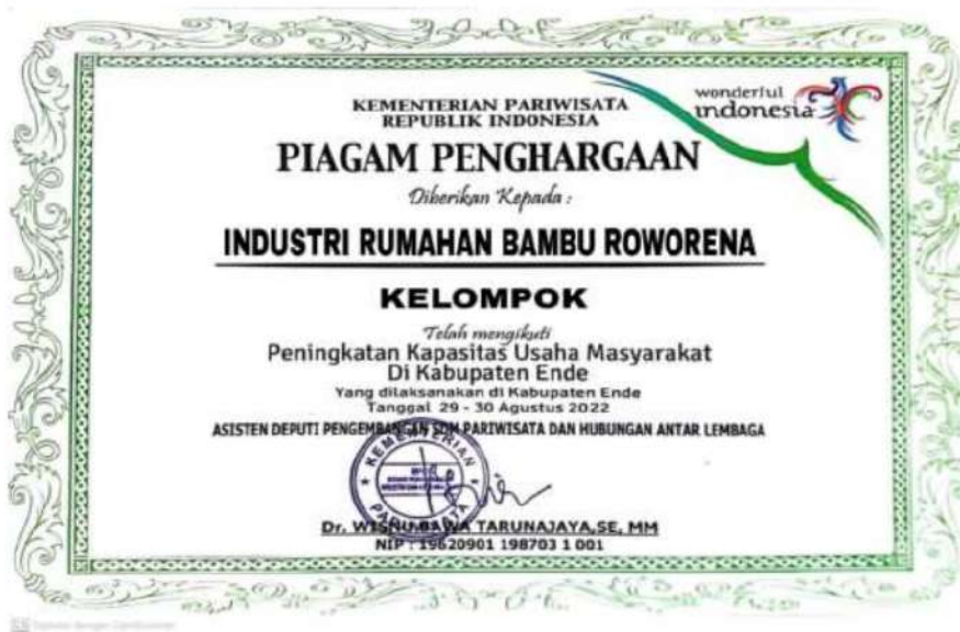
Gambar 1. 3 Piagam Penghargaan Industri Rumahan Anyaman Bambu Roworena

Berdasarkan pendekatan empowering, pemberdayaan masyarakat menganalisa potensi dan daya masyarakat kelurahan roworena. Langkah-langkah nyata yang diambil dalam upaya kemampuan kreatifitas, produksi, finansial, sumber daya manusia kompeten pada masyarakat kelurahan roworena. Pada kelurahan roworena pembangunan infrastruktur atau sarana dan prasarana belum tercipta dengan baik, dalam arti bahwa secara perlengkapan produksi industri rumahan masih menggunakan perlengkapan tradisional dan belum modern. Pemerintah Kelurahan Roworena telah berusaha memfasilitasi dalam melibatkan masyarakat mengikuti pelatihan dan pendampingan mengenai usaha industri rumahan anyaman bambu.