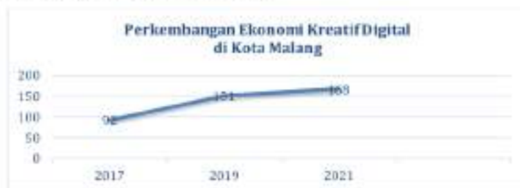
Gambar 1. Jumlah Dunia Usaha Kreatif Digital; Sumber : (Disporapar Kota Malang, 2022)

Dunia usaha pada kolaborasi hexahelix pengembangan ekosistem digital merupakan objek kreatifitas, dimana dunia usaha merupakan pelaku entitas utama dalam ekosistem digital kreatif. Dunia usaha bertindak sebagai pencipta dan investor produk dan layanan kreatif. Pelaku dunia usaha juga membangun jaringan komunikasi ataupun relasi, manajemen serta inovasi dengan sesama pelaku bisnis. Data Dinas Kepemudaan, Olahraga, dan Pariwisata Kota Malang menunjukkan pelaku ekonomi kreatif digital meningkat setiap tahunnya. Adapun perkembangannya seperti pada gambar berikut: