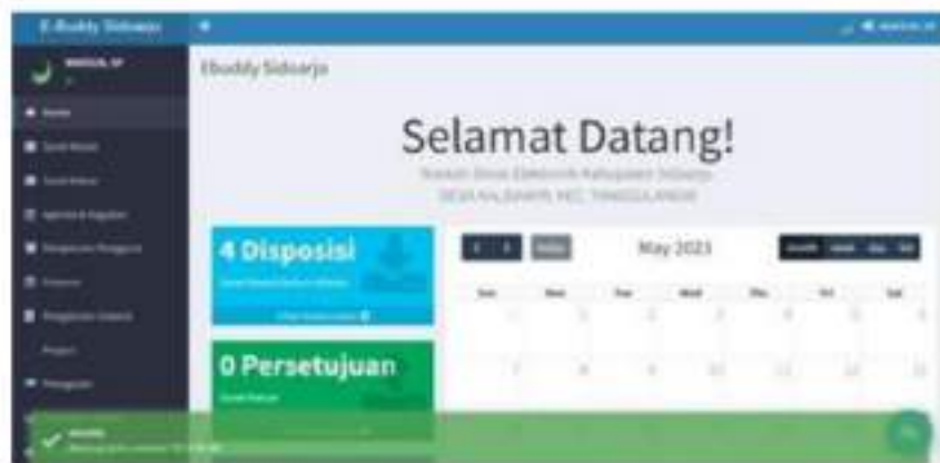
Gambar 2. Tampilan sistem e-buddy

Akuntabilitas, sebagai instrumen pertanggungjawaban keberhasilan dan kegagalan tugas pokok dan fungsi serta misi organisasi, memiliki peran penting dalam konteks pelayanan administrasi kependudukan di Desa Kalidawir, Kecamatan Tanggulangin. Menurut Adisasmita dalam (Purnama & Nadirsyah, 2016), menyatakan bahwa akuntabilitas di Desa Kalidawir dapat dianggap cukup baik. Ini terbukti melalui perwujudan kegiatan yang menjadi kewajiban para pegawai, termasuk absensi yang mencerminkan kinerja pegawai dalam mencapai tujuan yang telah ditetapkan. Hal tersebut juga didukung dengan kegiatan pengawasan yang ada dari masing-masing instansi pemerintah. Serta akuntabilitas terhadap kinerja pegawai telah dilaksanakan dengan melaksanakan absensi setiap hari melalui sistem e-buddy, aplikasi tersebut dimanfaatkan untuk menguatkan layanan dari Desa Kalidawir (Afrizal et al., 2021).