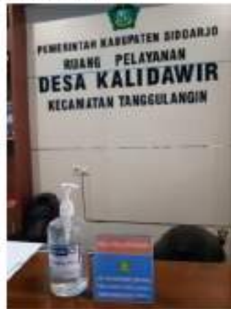
Gambar 5. Nomer Pelayanan di Desa Kalidawir

Responsibilitas dalam konteks pelayanan publik merujuk pada penerapan kegiatan birokrasi sesuai dengan asas administrasi yang baik dan kebijakan birokrasi, baik yang bersifat eksplisit maupun yang tidak. Selain itu, responsibilitas juga mencakup bagaimana masyarakat merespon pelayanan publik tersebut. Menurut Tamaka dalam (Afrizal et al., 2021), responsibilitas di Desa Kalidawir Kecamatan Tanggulangin menunjukkan bahwa organisasi dalam lingkungan pekerjaan sangat penting bagi kerjasama antar pegawai. Sebagian besar masyarakat memberikan respons yang positif terhadap pelayanan, namun terdapat beberapa keluhan yang menyatakan bahwa pelayanan masih kurang optimal.