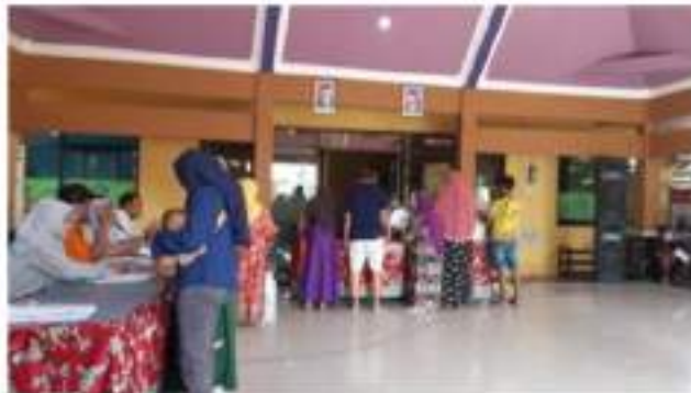
Gambar 1. Pelayanan di Desa Kalidawir

Produktivitas merupakan parameter penting dalam menilai tingkat efisiensi dan efektivitas pelayanan. Dalam konteks administrasi kependudukan di Desa Kalidawir, Kecamatan Tanggulangin, produktivitas diukur sebagai hasil dari input dan output yang dihasilkan. Menurut Schermerhorn, dalam (Fitrianti, 2023), mengatakan bahwa produktivitas sangat relevan untuk menilai kinerja, dan Desa Kalidawir dianggap telah mencapai tingkat produktivitas yang baik. Kerjasama antar pegawai dalam memberikan pelayanan kepada masyarakat diutamakan, menjadikan pelayanan publik sebagai fokus utama Desa Kalidawir.