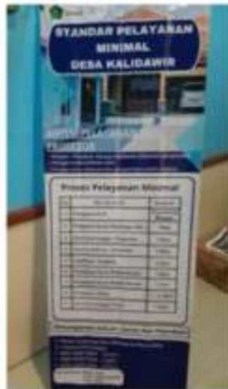
Gambar 4. Standar Pelayanan Minimal dan Prosedur di Desa Kalidawir

Meskipun terdapat komplain dari masyarakat, pegawai di Kantor Balai Desa Kalidawir tetap menunjukkan respon dan daya tanggap yang baik. Mereka berupaya memberikan pelayanan yang ramah, sopan, dan berusaha memenuhi kebutuhan masyarakat. Standar Pelayanan Minimal dan Prosedur di Desa Kalidawir (Gambar 4) merupakan format yang disediakan oleh pegawai desa untuk memperbaiki kualitas pelayanan. Demikian, masih terdapat ketidaksesuaian antara pengerjaan dengan standar pelayanan minimal dan prosedur yang telah ditetapkan. Pemerintah Republik Indonesia melalui Peraturan Pemerintah Nomor 2 Tahun 2018 menetapkan Standar Pelayanan Minimal (SPM) untuk memastikan setiap warga negara memperoleh pelayanan dasar dari pemerintah. SPM ini diharapkan dapat meningkatkan mutu pelayanan dasar, termasuk dalam pelayanan administrasi kependudukan untuk memenuhi kebutuhan dasar masyarakat. Hasil penelitian ini dapat dibandingkan dengan penelitian Mordani Fauzi Adri tentang "Kinerja Pegawai Dinas Kependudukan dan Pencatatan Sipil Kota Padang Dalam Pelaksanaan Administrasi Kependudukan". Penelitian tersebut menunjukkan pemahaman yang baik oleh pegawai di dinas kependudukan dan pencatatan sipil Kota Padang terhadap tupoksi masing-masing dalam pelayanan kependudukan. Namun, kekurangan tenaga masih menjadi hambatan dalam penerbitan dokumen, terutama E-KTP. Dinas tersebut bahkan melakukan tambahan tenaga untuk meningkatkan kecepatan dan optimalitas pelayanan