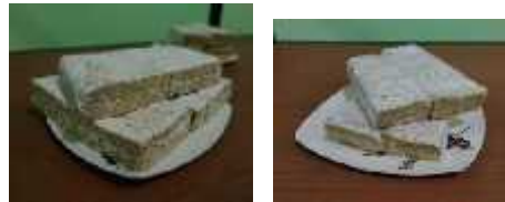
Gambar 5. Produk Tempe Tumpuk Dan Tempe Biasa

Peningkatan Kuantitas Produksi tempe Dan Peningkatan Pemahaman Manajemen Pemasaran Dan Sosial, Sehingga Tidak Menyebabkan Gangguan Lingkungan Sekitar Dan Pelaku Usahadapat Menjadi Lebih Kreatif Dan Produktif.