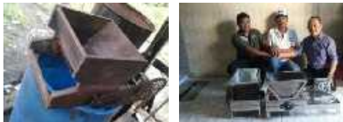
Gambar 1. Mesin Pemecah Kulit Kedelai Sebelum dan Sesudah Inovasi

Gambaran usaha mitra sebelum dan sesudah adanya dukungan peralatan yang dilakukan oleh tim IbM, antara lain :