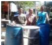
Gambar 2. Kondisi Alat Perebusan Dan Bak Perendamansebelum Dan Sesudah Inovasi