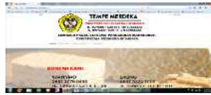
Gambar 4. Blog Internet Untuk Pengembangan Akses Pemasaran