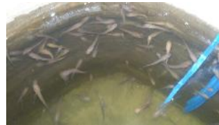
Gambar 5. Bibit Ikan Gabus yang telah di seleksi

Setelah melakukan seleksi ukuran bibit ikan Gabus, kemudian bibit tersebut langsung ditebar pada kolam yang telah disediakan sehingga bibit ikan Gabus tidak akan mengalami stres. Hal ini sesuai dengan pendapat Muflikhah (2008) yang menyatakan bahwa ikan gabus adalah ikan yang mudah stres.