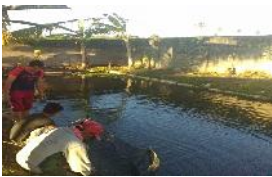
Gambar 3. Kolam yang akan digunakan untuk melakukan Budidaya Ikan Gabus di Desa Tunggulo.