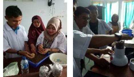
Gambar 9. Pembuatan pakan Buatan oleh Mitra

mitra telah memiliki keterampilan cara pembuatan pakan yang baik dari segi pemilihan bahan untuk pakan serta komposisi dari bahan-bahan yang digunakan.