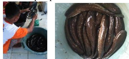
Gambar 10. Hasil Panen Budidaya Ikan Gabus

Berdasarkan hasil panen dari kegiatan usaha budidaya ikan gabus pada saat produksi pertama dari mitra, mitra mendapatkan keuntungan sebesar Rp. 12.000.000,-. Dalam hal ini terjadi peningkatan kesejahteraan dari anggota mitra kelompok pemuda.