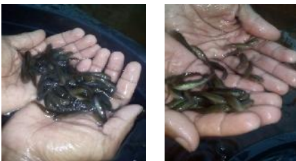
Gambar 4. Bibit Ikan Gabus yang terseleksi (kiri) dan tidak terseleksi (kanan)

Setelah melakukan seleksi ukuran bibit ikan Gabus, kemudian bibit tersebut langsung ditebar pada kolam yang telah disediakan sehingga bibit ikan Gabus tidak akan mengalami stres. Hal ini sesuai dengan pendapat Muflikhah (2008) yang menyatakan bahwa ikan gabus adalah ikan yang mudah stres.