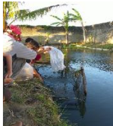
Gambar 8. Penebaran benih ikan Gabus oleh kelompok Pemuda Desa Tunggulo

Penebaran benih ikan Gabus dilakukan pada waktu sore hari untuk meminimalisir tingkat stres yang akan terjadi pada bibit ikan Gabus. Kondisi suhu pada sore hari tidak terlalu tinggi sehingga proses adaptasi ikan Gabus terhadap kondisi perairan bisa lebih baik dari pada melakukan penebaran ikan pada siang hari.