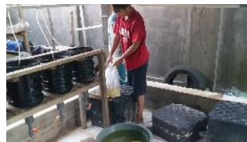
Gambar 6. Bibit Ikan Gabus yang akan dikepak untuk ditebar ke kolam budidaya.

Kegiatan selanjutnya, pengepakan ikan Gabus yang terseleksi yang selanjutnya ditebar ke dalam kolam yang telah disediakan. Pengepakan dilakukan dengan memasukkan ikan ke dalam plastik khusus yang telah dilengkapi dengan air kemudian ditambahkan oksigen. Setelah kantong mengembang terisi oksigen kemudian diikat dengan tali pengikat yang telah disediakan.