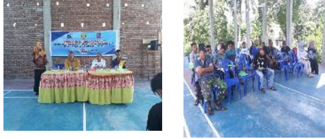
Gambar 7. Pelaksanaan penyuluhan PKM Pemberdayaan Pemuda Desa Tunggulo Kecamatan Limboto Barat melalui Budidaya Ikan Gabus.

baik. Dengan meningkatnya keterampilan mitra dalam budidaya ikan gabus diharapkan bisa diaplikasikan ke masyarakat sekitar Desa Tunggulo.