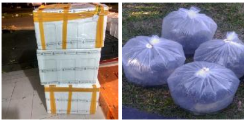
Gambar 2. Pengepakan bibit ikan Gabus yang akan diangkut ke Desa Tunggulo

perawatan kolam yang baik untuk kegiatan budidaya. Selama kegiatan persiapan kolam mitra juga melakukan pengadaan bibit ikan Gabus yang didapatkan melalui UPR Lele Koala kabupaten Bone Bolango sebagai penampung tetapi bibit ikan Gabus tersebut dikirim dari kabupaten Karang asem, Surabaya. Dalam hal ini mitra telah memiliki keterampilan memilih bibit ikan berkualitas dan perhitungan padat tebar ikan yang akan ditebar sesuai dengan luasan kolam. Seleksi bibit ini dimaksudkan agar usaha budidaya ikan Gabus dapat berhasil karena Sifat ikan Gabus yang kanibal mengharuskan di dalam penebarannya ukuran bibit terseleksi seragam. Ukuran bibit yang berbeda saat ditebar akan mengumpukan ikan besar untuk memangsa ikan yang lebih kecil.