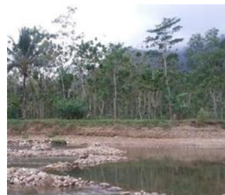
Gambar 1. Kondisi Sungai yangbebatasan dengan Dusun Punjul

Daerah Aliran Sungai (DAS) merupakan suatu hamparan wilayah dimana air hujan yang jatuh di wilayah itu akan menuju ke satu titik outlet yang sama, baik sungai, danau, maupun laut (Suryadi, 2016).