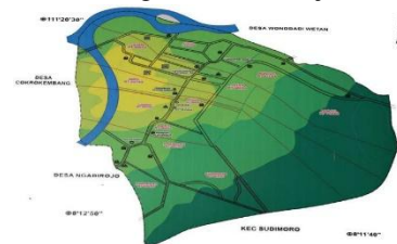
Gambar 2. Denah Desa Bogoharjo

Berdasarkan Gambar 2 diatas, Bogoharjo dikelilingi oleh Sungai besar yang memiliki potensi terkena banjir saat musim penghujan tiba. Untuk itu dibutuhkan sebuah alat yang dapat memperingatkan