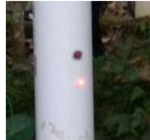
Gambar 5. Lampu Indikator dan Saklar