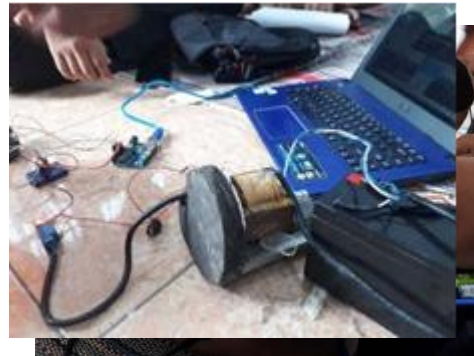
Gambar 3 Proses Pengecekan sensor pendeteksi air

Alat diambil dari lokasi awal. Kemudian tahap selanjutnya adalah pemeriksaan alat. Alat diperiksa dengan merekayasa seolah terjadi banjir dengan merendam bagian sensor ke dalam air. Alat mengalami kerusakan pada sensor pendeteksi banjirnya dengan tanda sirine pada alat tidak berbunyi. Sehingga perlu diadakan kegiatan reparasi dan pemrograman ulang alat pendeteksi banjir. Serta menambahkan beberapa komponen yang dapat mempermudah warga Desa Bogoharjo mengoperasikan alat tersebut, dengan menambahkan lampu indikator dan tombol saklar, sebagai tombol power Alat Pendeteksi Banjir.