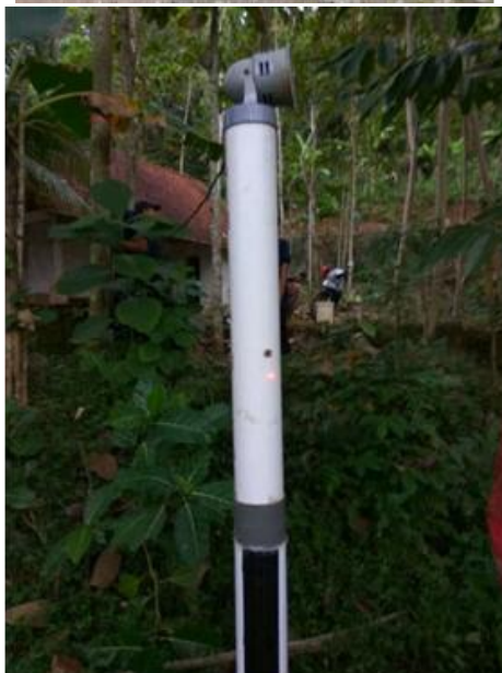
Gambar 4. Proses perakitan alat banjir dan alat pendeteksi banjir