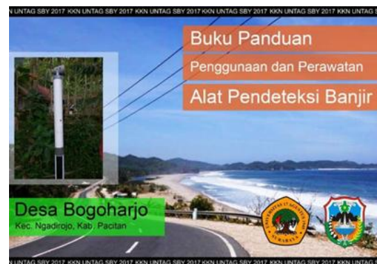
Gambar 6. Cover buku panduan