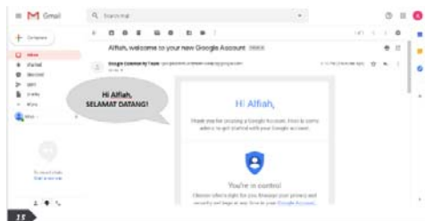
Gambar 7. Contoh isi panduan email

Catering Oke La Beb Go Online dimulai dengan pengenalan dan pembelajaran penggunaan teknologi digital. Hal pertama yang dilakukan adalah dengan pembuatan email. Pada saat proses pembuatan email dilakukan bersama dengan Ibu Alfiah, sehingga setiap proses yang dilakukan dapat dikenali oleh Ibu Alfiah dengan baik dan dapat dipraktikkan ketika suatu saat akan mengembangkan akun email lebih dari satu sebagai kebutuhan pemasaran produk catering Oke La Beb. Mengingat kemampuan mengingat yang terbatas seperti yang disampaikan oleh pemilik usaha, maka tim pelaksana kegiatan pengabdian kepada masyarakat menyediakan panduan praktis tahapan pembuatan email yang dapat digunakan oleh Ibu Alfiah maupun karyawan yang lain secara berkelanjutan.