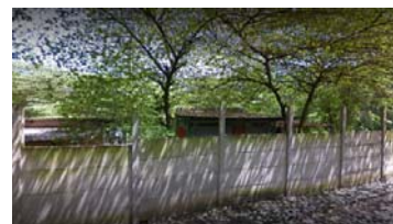
Gambar 4. kondisi terkiri kedai prasmanan Oke La Beb yang ditutup pagar permanen

Peran utama sebagai seorang pelaku usaha terlebih di bidang makanan, perlu dengan meningkatkan kapasitas diri untuk berkomunikasi dan memasarkan. Banyak usaha makanan atau catering yang tidak mau mengembangkan usahanya di bagian pemasaran dan akhirnya gulung tikar. Ibu Alfiah sebagai pelaku usaha catering Oke La Beb perlu diberikan pembelajaran awal mengenai perkembangan dunia saat ini agar mau lebih meningkatkan diri sesuai dengan perubahan yang terjadi. Melalui kegiatan pengabdian masyarakat ini, pola pikir yang masih konvensional tentang pemasaran harus diubah.