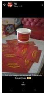
Gambar 9. Penggunaan fitur status pada whatsapp dan kemasan kekinian catering Oke La Beb