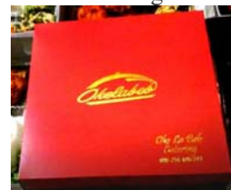
Gambar 6. Contoh aplikasi logo dalam meal box Catering Oke La Beb

Proses selanjutnya dalam kegiatan pengabdian kepada masyarakat ini adalah dengan membuat logo usaha catering Oke La Beb. Pembuatan logo ini bersama dengan pemilik usaha yang telah mendapatkan tambahan pengetahuan dan pemahaman tentang pengembangan system pemasaran. Logo tersebut berwarna abu-abu dengan latar transparan dengan harapan dapat memberikan kesederhanaan dalam setiap menu yang disajikan. Hal ini karena menu yang disediakan oleh usaha catering Oke La Beb tersebut adalah menu-menu rumahan dengan cita rasa yang istimewa, sehingga ketika logo digunakan akan terlihat sederhana namun elegan. Selanjutnya penulisan dibuat miring ke kanan untuk menunjukkan bahwa usaha catering Oke La Beb selalu mengikuti perkembangan jaman dan maju ke depan. Symbol atau tanda tempat makanan juga tampak menghiasai sekitar tulisan. Tempat makanan atau wadah tersebut identik dengan tempat makanan yang digunakan pada tatanan catering. Hal ini memberikan peluang bagi Usaha Catering Oke La Beb agar tetap bisa menjalankan usaha cateringnya tidak hanya dengan pemasaran luring yang selama ini dilakukan namun juga dengan pemasaran daring. Usaha catering bisa dilakukan secara luring maupun secara daring.