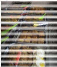
Gambar 1. menu yang disajikan oleh Usaha Catering Oke La Beb

Pada tahun 2015 Oke La Beb berkembang dari yang awalnya hanya menerima pesanan dari rumah menjadi sebuah kedai di wilayah dekat dengan Universitas Ciputra. Kedai tersebut berkonsep prasmanan dengan pelanggan mengambil sendiri makanan. Namun, karena adanya ketidakstabilan status tanah yang ditempati kedai prasmanan Oke La Beb akhirnya harus ditutup secara permanen. Padahal pelanggan sudah cukup banyak sehingga omzet yang diterima oleh Oke La Beb pernah mencapai lebih kurang Rp 1.000.000,-/hari.