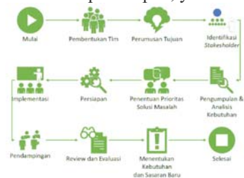
Gambar 2. Alur kerja kegiatan pengabdian kepada masyarakat

(Ife & Tesoriero, 2008) menjelaskan bahwa pemberdayaan merupakan upaya meningkatkan kepercayaan diri masyarakat yang diberdayakan. Hal ini merupakan salah satu agenda perubahan mental dan spiritual. Menurut (Ife & Tesoriero, 2008) cara yang tepat langsung dilakukan di lapangan dengan memberikan pelatihan, kunjungan lapangan dan pendampingan. Metode ini yang dilakukan dalam kegiatan pengabdian kepada masyarakat ini. Dapat digambarkan pada diagram alir secara bertahap bahwa kegiatan pengabdian masyarakat ini memiliki beberapa tahapan, yaitu: