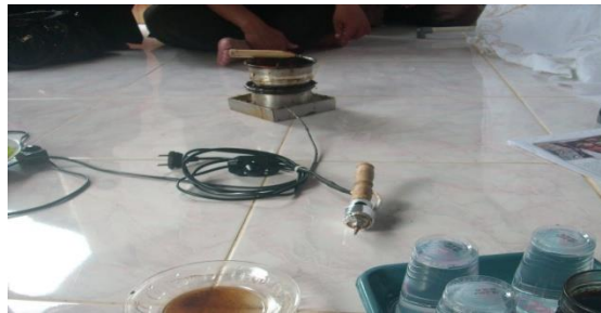
Gambar 4: Canting elektronik (alat pembatik elektrik)