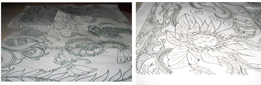
Gambar 1: Pembuatan desain/motif batik di Kertas Blat

Dari Aspek produksi: hasil produksi batik di Dukuh Kupang masih belum terlalu besar, tiap pengrajin dapat menghasilkan 4 Lembar batik dalam satu bulan. Hal ini sangat tergantung pada tingkat kerumitan desain. Saat ini hasil produksi kelompok batik ini masih kurang maksimal. Produk batik Surabaya ini belum dapat memenuhi permintaan pasar, sementara permintaan akan batik Surabaya cukup banyak. Biasanya begitu pengrajin menyelesaikan pembatikannya secara total, saat itu juga langsung dibeli oleh konsumen. Jadi belum sempat ada stock barang, sehingga kalau konsumen berminat membeli harus memesan terlebih dahulu dengan waktu yang cukup lama. Kondisi ini merupakan kendala yang dihadapi oleh kelompok perajin batik ini adalah dalam membuat desain motif batik melalui kertas blat dan sangat lambat. Gambar dibawah ini merupakan contoh Membuat Desain / Motif batik di kertas blat yang dilakukan selama ini.