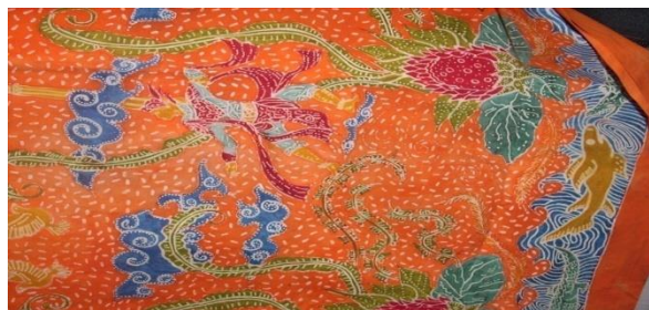
Gambar 7: motif Batik Tari Remo dan Ikan Suro.