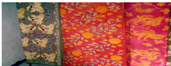
Gambar 6: motif Batik Flora dan Fauna