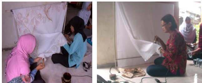
Gambar 5: Kelompok Pembatik Dukuh Kupang