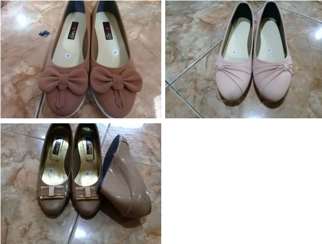
Gambar 9. Berbagai model sepatu