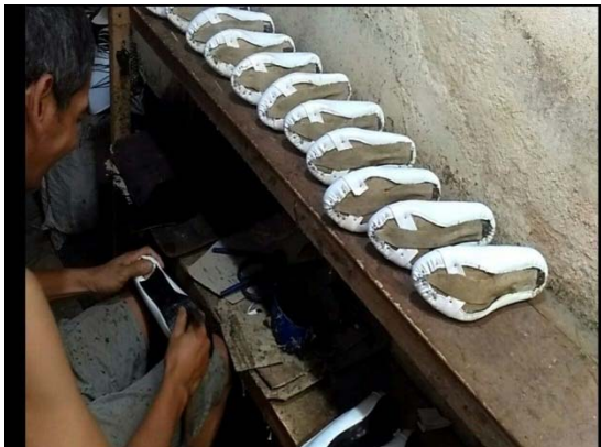
Gambar 1. Alat Pres Manual

Peran akademisi sangat diperlukan memberikan edukasi berupa pelatihan dan pendampingan yang intensif sehingga meningkatkan kesejahteraan masyarakat yang diukur dengan meningkatnya pendapatan, pendidikan, kesehatan dan sosial masyarakat industri kecil khususnya industri kecil sepatu di Desa Kemasan Kecamatan Krian.