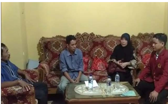
Gambar 9. Pelatihan Akuntansi Sederhana