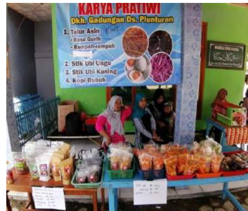
Gambar 3. Hasil produksi industry rumahan desa Plunturan