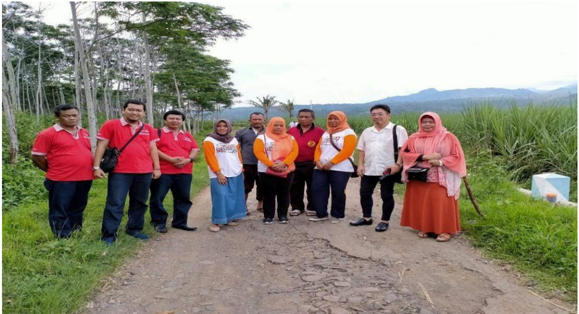
Gambar 2. Pemandangan Alam desa Plunturan