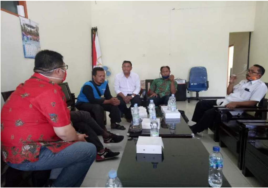
Foto 3 : Narasumber dalam FGD (Forum Group Diskusi) saat Tanya jawab.