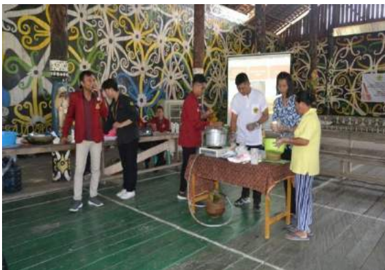
Gambar 4. Demo Produk umbut rotan dan bawang Dayak