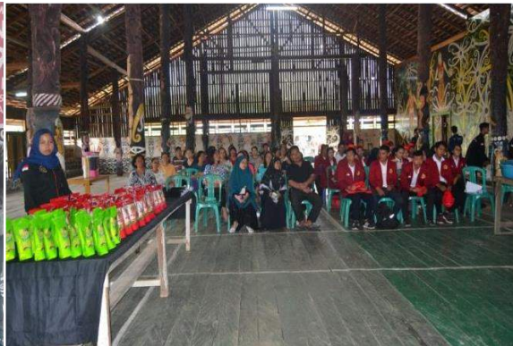
Gambar 3. Peserta dan Panitia