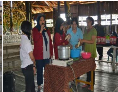
Gambar 5. Demo Produk Keripik Biji Karet